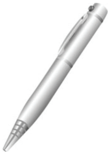
NARAE BIZ PEN [ 보이스레코더 펜 ]