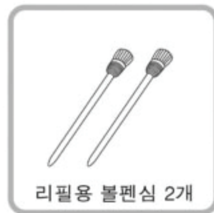
리필용 볼펜심 2개